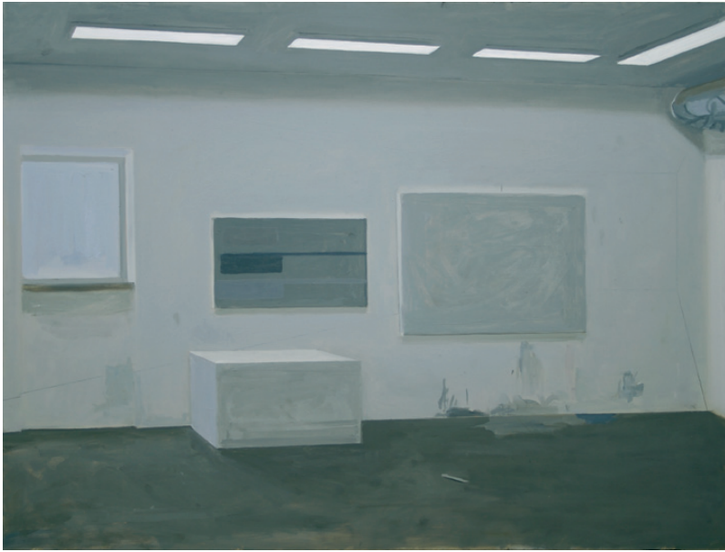
Richard G. Carlsson Studio